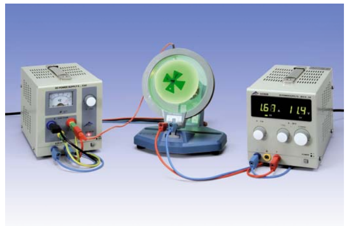
Fig. 3: Montaje experimental modificado con campo magnético axial adicional