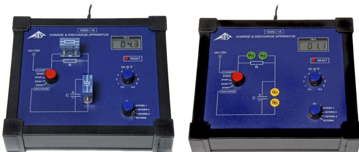
Fig. 1: Aparelho de carga e de descarga em operação com par de resistores/capacitores externo (esquerda) e interno (direita).