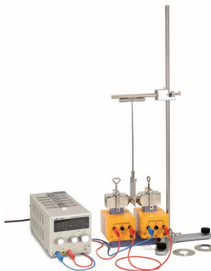
Fig. 2 Montagem pêndulo de Waltenhofen