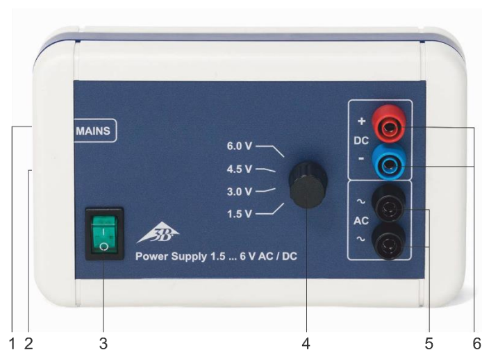
Fig. 1: Elementos de servicio