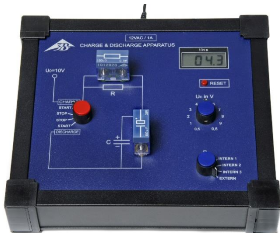
Fig. 1 Medição de par externo de Resistência / Capacitor