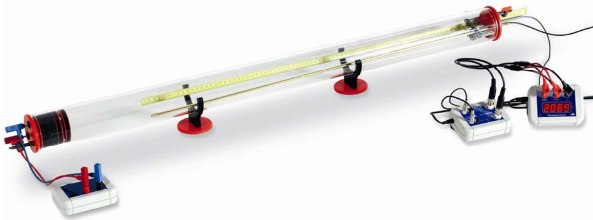
Fig. 1 Montaje experimental con el tubo de Kundt