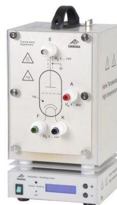
Fig. 1 Estufa de calentamiento con el tubo de Franck-Hertz Hertz lleno de Hg (115 V: 1006794, 230 V: 1006795)