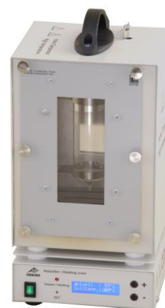
Fig. 2 Estufa de calentamiento con el tubo de fluorescencia del Na (1000913)