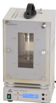
Fig. 2 Four de chauffage avec le tube fluorescent au sodium (1000913)