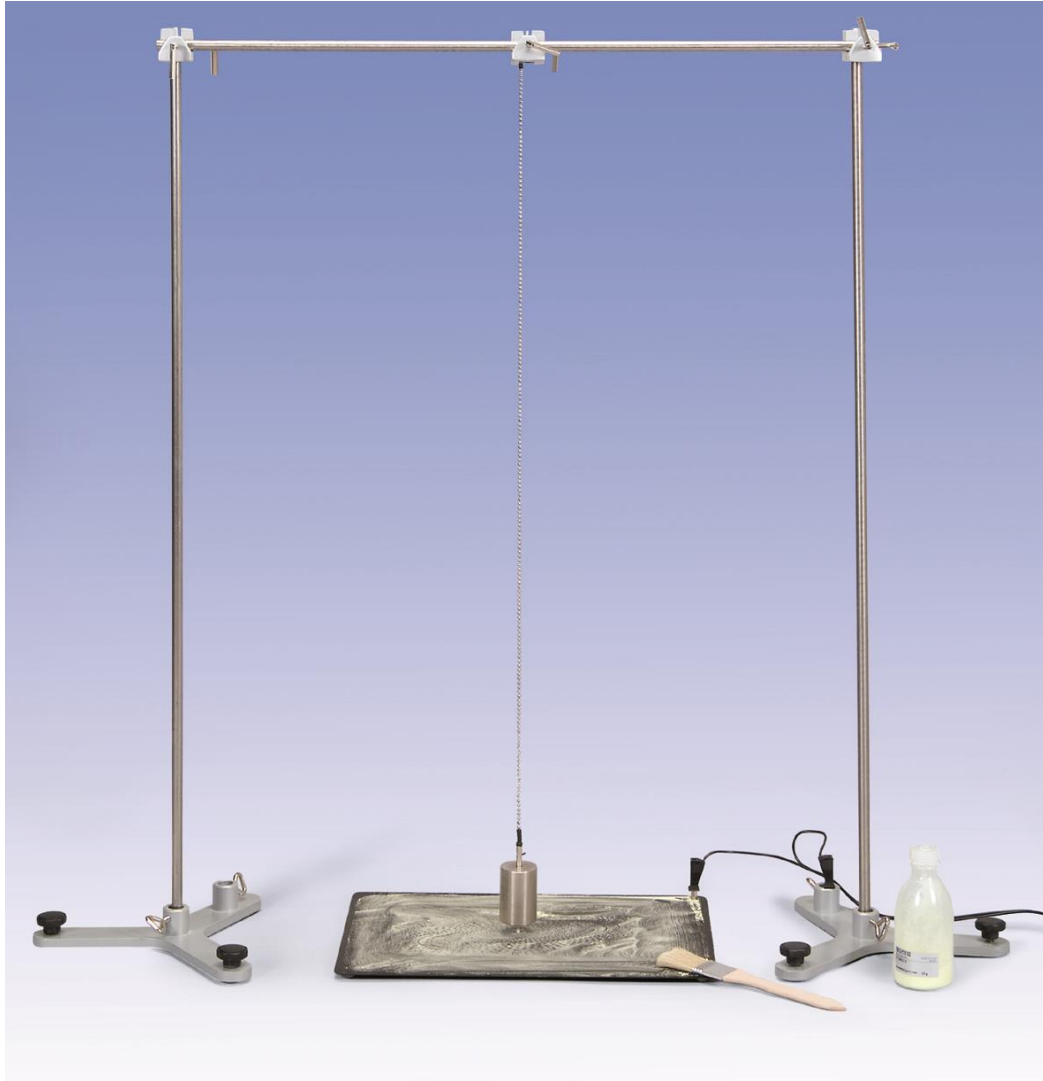
Fig. 2 Montaje experimental: Comprobación de la ley de áreas para los movimientos de fuerza central (Segunda ley de Kepler)