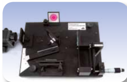
Plaque en verre dans la marche du rayon de l'interféromètre de Michelson.