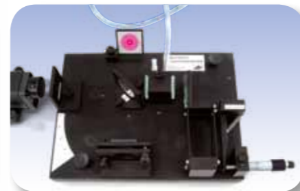
Chambre à vide dans la marche du rayon de l'interféromètre de Michelson.